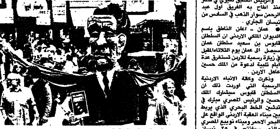
معية تمثل ريفان في مقدمة التظاهرة الاحتجاجية في لوس انجلوس (أ.ب.)

أكد الرئيس الامريكى ريفان أمس الأول ان حكومته حصلت على انباء مؤيدة بان هناك جنودا سوفيات في متلف القتال الواقعة في شمالي نيكاراغوا. وقال ريفان في خطبه الاسبوعي الذي تلقاه الازاعة. لقد تاكنا هذا الاسبوع من وجود قوات سوفياتية في متلف القتال بضماني نيكاراغوا. وكرر من جديد ان انصار الرئيس الليبي معمر القذافي واية الله الخميني موجودون في نيكاراغوا في مساندة قطعها طائرة من الولايات المتحدة في ساعاتها.